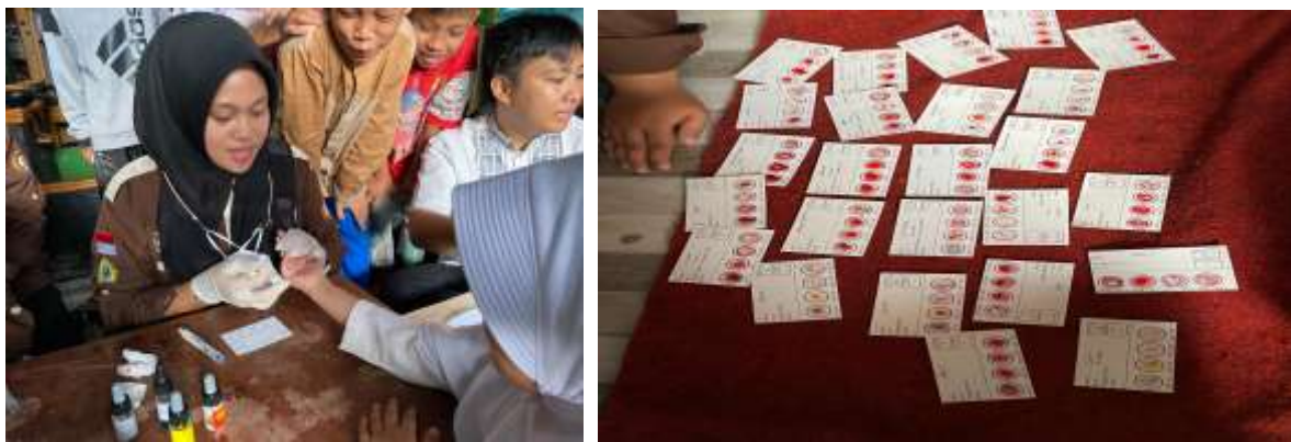
Gambar 2. Pemeriksaan Golongan Darah

Menurut (Sangrahan, 2023), menjelaskan mengenai pentingnya pemeriksaan golongan darah pada masyarakat salah satunya adalah langkah awal dalamantisipasi transfusi jika dilakukan serta penting dalam melakukan pemeriksaan secara klinis. Jika individu sudah mengetahui mengenai golongan darahnya maka hal ini akan menjadi langkah untuk menghindari terjadinya kesalahan dalam proses transfusi.