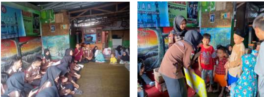
Gambar 1. Pembukaan dan Penyampaian materi

Pelaksanaan pengabdian masyarakat ini dilakukan dengan penyuluhan dan pemeriksaan golongan darah. Pengabdian masyarakat dimulai dengan pembukaan, sambutan oleh Ketua Panitia dan arahan dari ketua pengabdian masyarakat dan pimpinan panti asuhan bintang terampil, penyampaian materi edukasi atau penyuluhan tentang pentingnya indentifikasi golongan darah dengan alat bantu berupa poster yang di tempelkan di styrofoam yang telah dipersiapkan dengan judul “Kenali Golongan Darahmu”. Materi yang disampaikan dalam penyuluhan meliputi pengertian darah, pengertian golongan darah, jenis golongan darah, dan manfaat mengetahui golongan darah. Acara penyuluhan diakhiri dengan kegiatan tanya jawab antara anak panti asuhan. Kemudian dilaksanakan pemeriksaan golongan darah dengan cara slide.